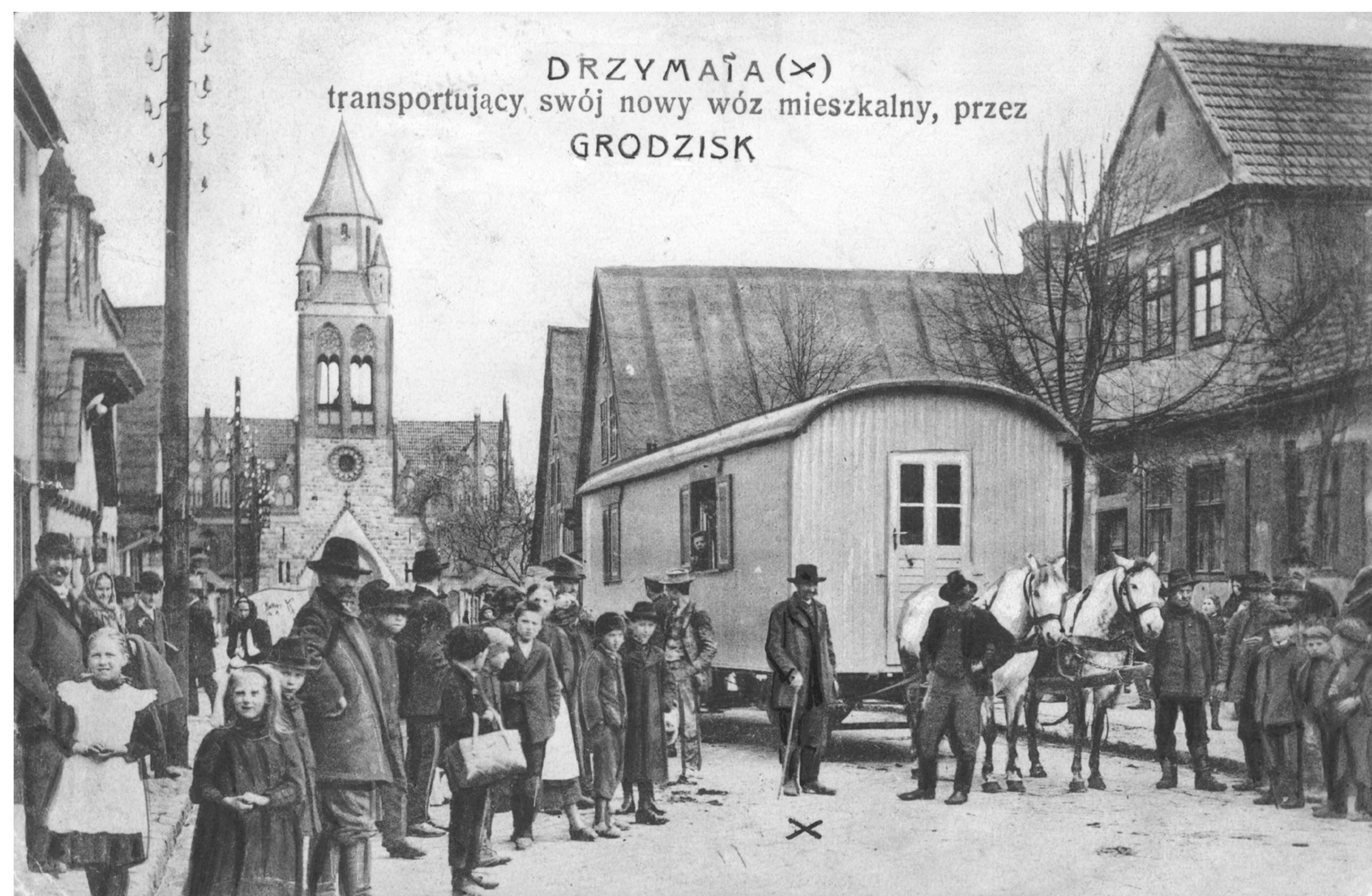
Wóz Drzymały na rynku w Grodzisku

Mniej restrykcyjną politykę wobec Polaków prowadziły władze w zaborze austriackim. W ramach autonomii przyznawanej Galicji stopniowo w latach 1860–1873, utworzony został m.in. Sejm Krajowy z siedzibą we Lwowie. W administracji, policji i sądownictwie od końca lat sześćdziesiątych obowiązywał język polski. Polskie było również szkolnictwo, w tym dwa stojące na wysokim poziomie uniwersytety: w Krakowie i we Lwowie, a także najważniejsza na ziemiach polskich instytucja naukowa: krakowska Akademia Umiejętności.