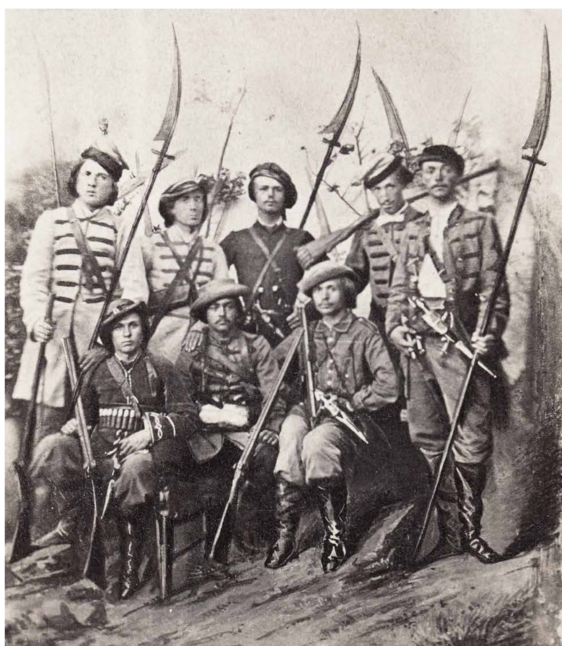
Powstańcy styczniowi uzbrojeni w kosy

Walka z zaborcą rosyjskim była nierówna. Rosjanie ściągali nowe oddziały wojskowe i nasilali terror.