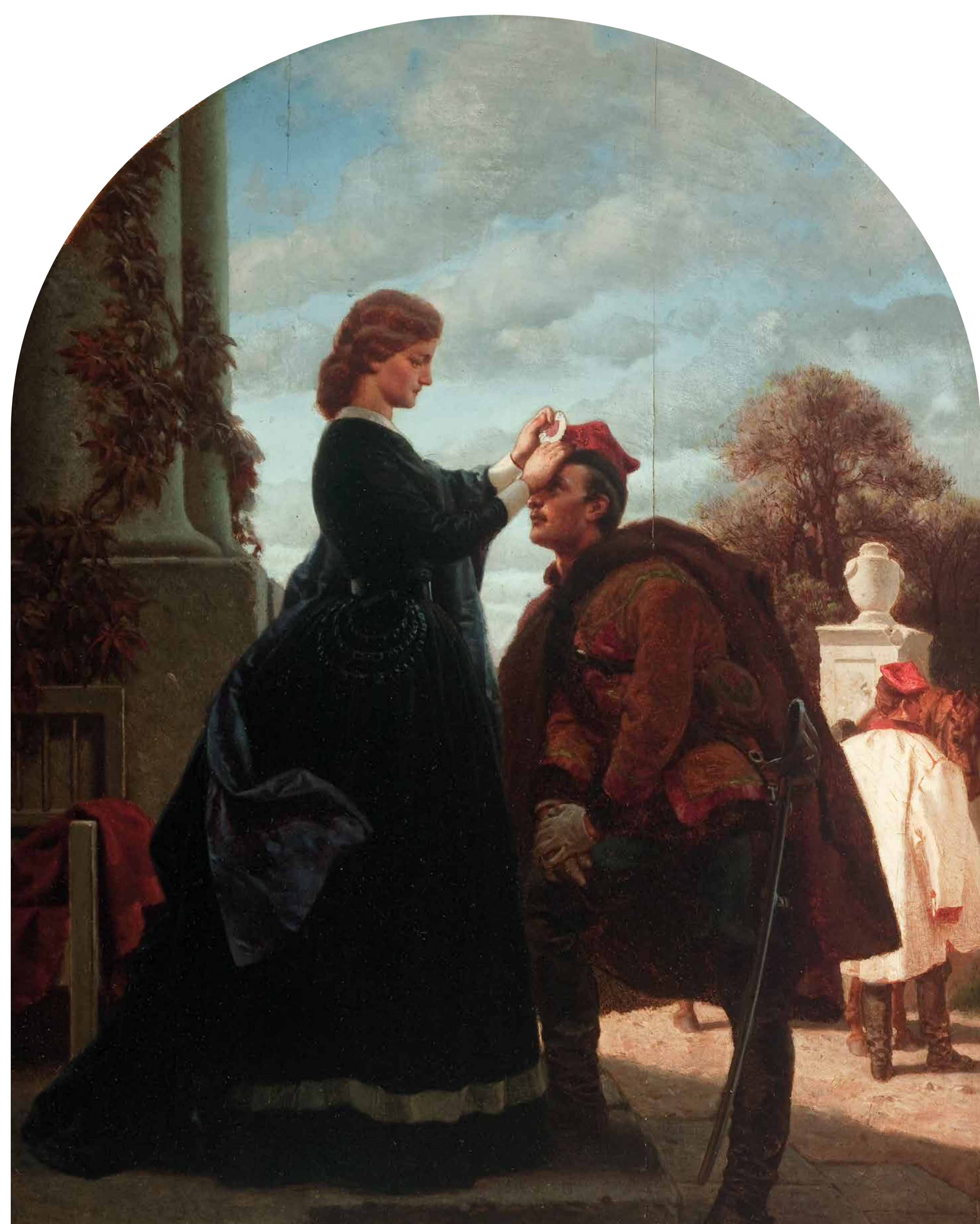
A. Grottger, Pożegnanie powstańca , 1866, Muzeum Narodowe w Krakowie

Popowstańczej literaturze zawdzięczamy przede wszystkim zmodyfikowany obraz konspiratora-powstańca, nie jest to już natchniony kadet o cechach wieszca, a partyzant w dwudziestowiecznym rozumieniu (powstańcy kryją się przede wszystkim po wsiach, miasteczkach, lasach, karczmach). Sztuka ukazuje także model idealnej towarzyszkii powstańca, kobiety szlachetnej, oddanej, czekającej w dworze na jego powrót, obmywającej rany, pielęgnującej, modlącej się.