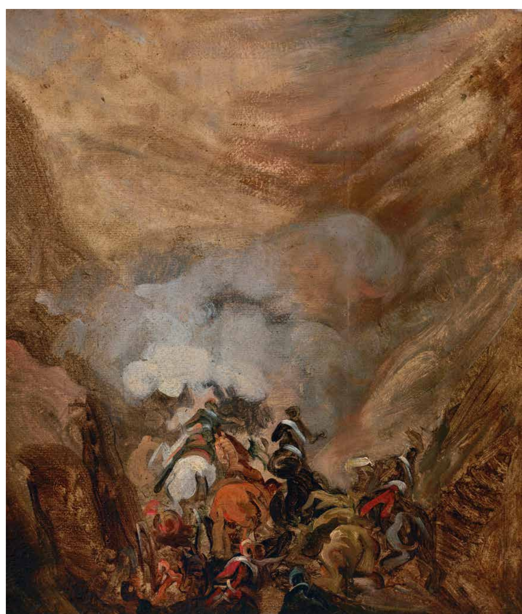
P. Michałowski, Szarża w wąwozie Samosierry , ok. 1837, Muzeum Narodowe w Krakowie

Marzenia o choćby częściowo niezależnym bycie państwowym stały się realne w 1806 r., kiedy walczące z Prusami wojska napoleońskie wkroczyły na ziemie polskie. W wyniku antypruskiego powstania w Wielkopolsce utworzone zostały polska administracja i wojsko.